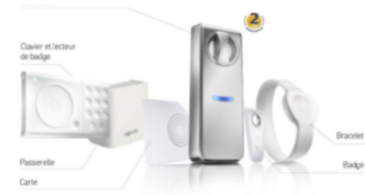
Door keeper SOMFY