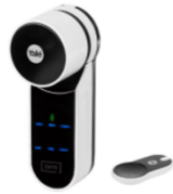
Serrure connectée ENTR

Visualiser les vidéos montrant 3 serrures connectées dans le dossier indiqué par le professeur, répondre aux questions suivantes :